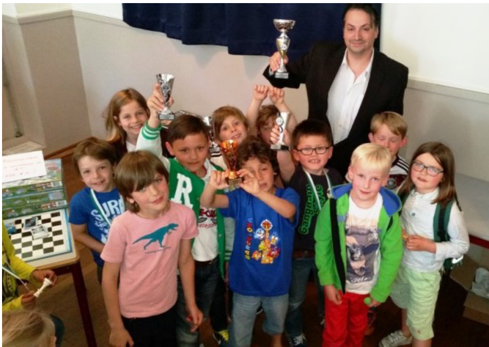
De schakertjes van RSV

De Eduard van Beinum en de RSV mochten vanwege hun goede resultaat meedoen met het NK. Hieraan deed ook Kop van Zuid mee. Hierin behaalde RSV een hele mooie 2 e plaats met 119,25 punten. Eduard van Beinum werd met 115,50 punten netjes 4 e . Kop van Zuid werd in de categorie tot 5 spelers 8 e .