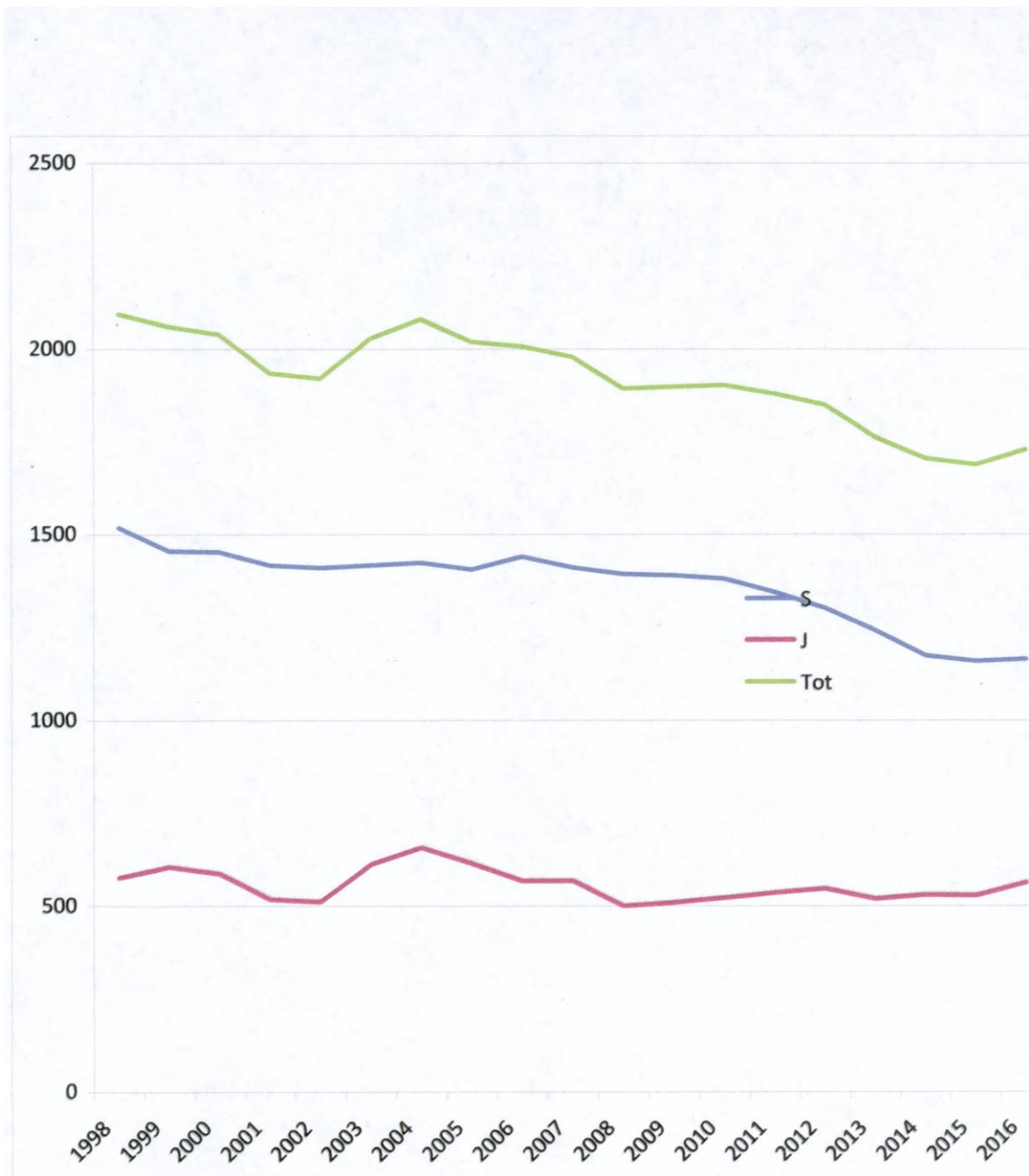
Ledenverloop RSB-hoofdleden 1998 – 2016 (A. Ayala 2016)