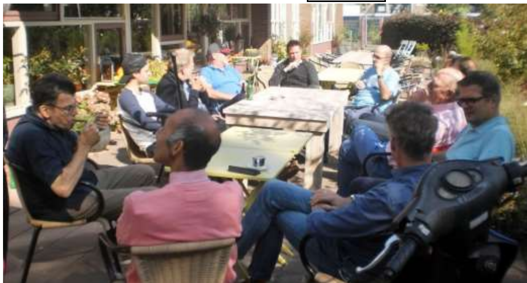
Sfeer zat er goed in op het mooie terras van de Crabbehoeve