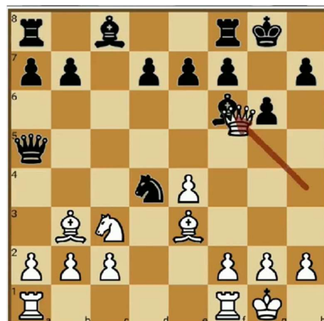
Dameoffer Nezhmetdinov - Chernikov (1962)