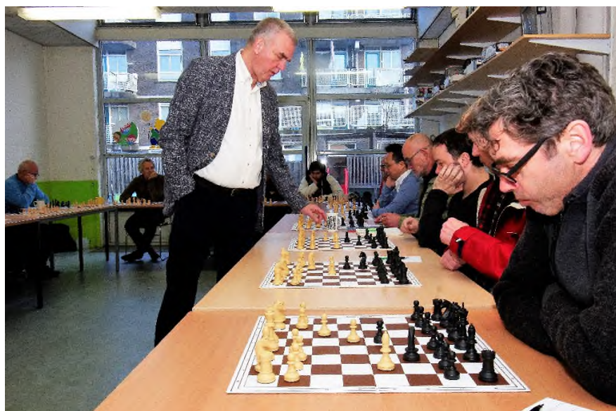
Zwoegen voor de volgende zet

De simultaan begon rond 13:30 en duurde tot bijna 18:00. Voor de 18 Onésimianen zou het lastige middag worden. Aan 18 borden werden 14 Onésimianen door Hans gekraakt.