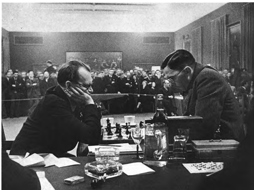
Max Euwe (rechts) in gevecht met Aljechin om de wereldtitel in 1935

Hans hield in de ochtend eerst een lezing over de opkomst van onze enige wereldkampioen schaken: Max Euwe. Euwe werd in 1921 Nederlands kampioen en in 1935 wereldkampioen.