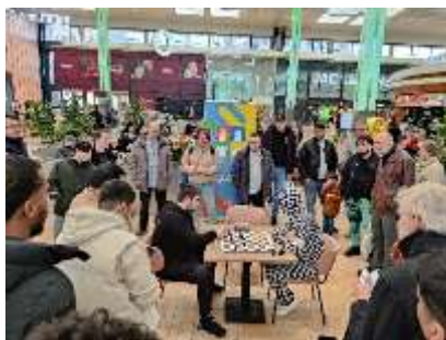
Mr. X op het Rotterdamse Zuidplein

's Middags moest hij zijn bezoek onderbreken om naar een ander schaakevenement in Rotterdam te gaan. Mr. X was namelijk aanwezig in het winkelcentrum Zuidplein. Ook hier veel belangstelling.