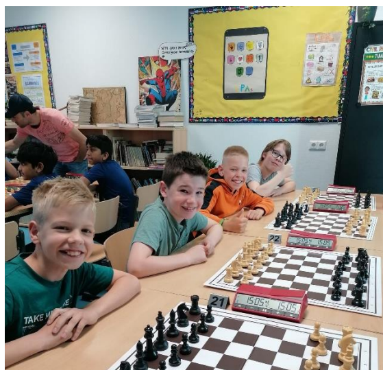
De toppers van de St. Jozefschool