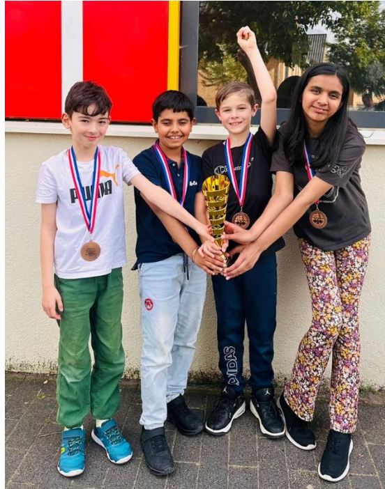
De toppers van de Harbour International School