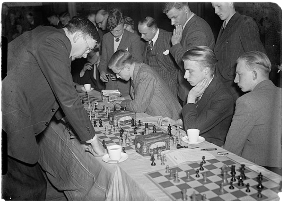
Max Euwe in 1946.

Max Euwe speelde na de Bevrijding in dit Gelderse dorp om geld op te halen voor de nabestaanden.